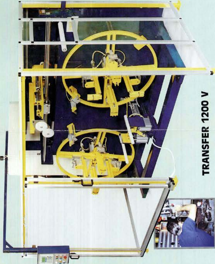
TRANSFER 1200 V